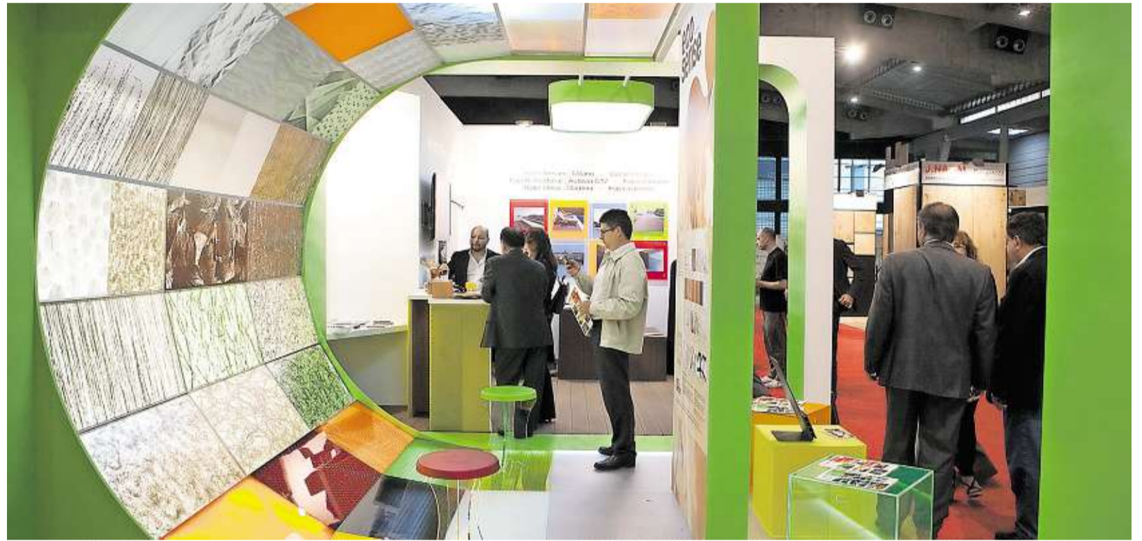
PŘÍŠTÍ TÝDEN Ve španělské Barceloně se každý druhý rok scházejí tisíce vystavovatelů na jednom z největších stavebních veletrhů v Evropě. Veletrh, který se koná již příští týden, tentokrát počítá s osmi hlavními sekcemi. Mezi nimi bude například udržitelná výstavba, stavební stroje nebo truhlářství a sklo.

Právě toto téma organizátoři zvolili z toho důvodu, že se mezi vystavovatelé těší v poslední době velké oblibě. Akce tradičně zahrnuje prakticky všechna zákoutí průmyslových odvětví, dotýká se strojů, materiálů i technologií. Každý rok na ni přijede více než 1500 vystavovatelů, z nichž víc než třetina pochází z ciziny. Organizátoři také pravidelně počítají s účastí okolo 80 tisíc návštěvníků, zhruba desetina z nich zpravidla dorazí ze zahraničí.