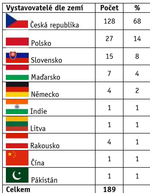
Podíl vystavovatelů z ČR a zahraničí