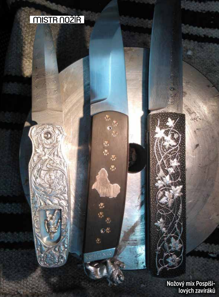
Nožový mix Pospíšilových zavíráků