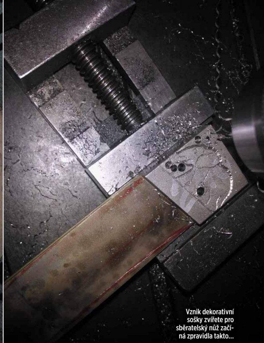
Vznik dekorativní sošky zvířete pro sběratelský nůž začíná zpravidla takto...